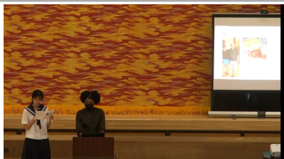
本部っ子短期留学報告