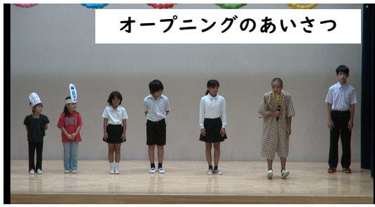
オープニングのあいさつ