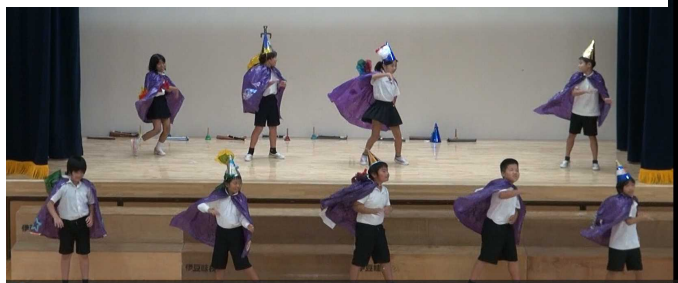
元気はつらつ！ The World of 3・4年生

幼・1・2年では大きく育てていずみのかぶ。5・6年生ではわった島の宝の劇を披露しました