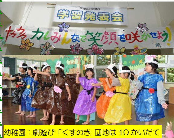
幼稚園：劇遊び「くすのき 団地は10かいだて

学習発表会が十一月五日（金）に実施された。今年のテーマは「協力し、みんなで笑顔を咲かせよう」として、短期間でしたが練習に励んだ。特に、五、六年生は、コロナの影響で直前に体験学習をせざるを得ない状況の中、素晴らしい発表が出来ました。久し振りに多数の保護者の皆さんに見に来て頂き、子どもたちも張り切って発表できました。参観誠にありがとうございました。