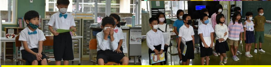
上：幼稚園生の劇 下：小1,2年 発表