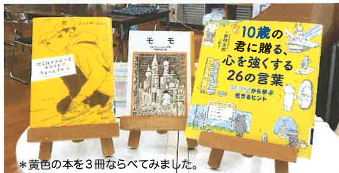
*黄色の本を3冊ならべてみました。