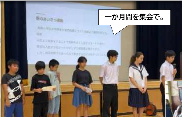
一か月間を集会で。