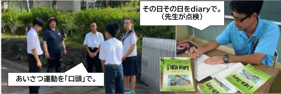
その日その日をdiaryで。 (先生が点検)