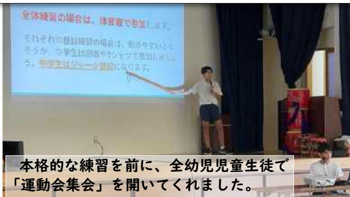
本格的な練習を前に、全幼児児童生徒で「運動会集会」を開いてくれました。