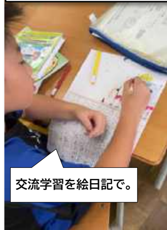
交流学习を絵日記で。

学校での「活動」「学び」には必ず何か「めあて」があります。学んだあとに子どもたちは「振り返り」という活動を行います。活動内容や、学びのスタイルによって「振り返り」の活動も様々なスタイルを用いています。その場で「口頭」で行ったり、ノートに文章で書いたり、クローム・ブックでまとめたりもします。それを行うことで「書く力」や「伝える力」が育まれていきます。 伊豆味小中学校ではその一連の学びの過程の中でも、特に「振り返り」に力を入れていきます。「振り返り」をしっかり意識することで、学びを自己評価し自己理解が深まります。そして次の目標(めあて)に向かうことで、自ら「成長」する子どもたちになって欲しいからです。